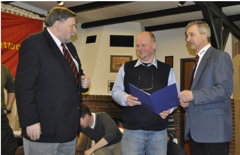
Ehrung und Übergabe der Urkunde

seit 2009 technischer Leiter Ausbildung in der OG Wunstorf