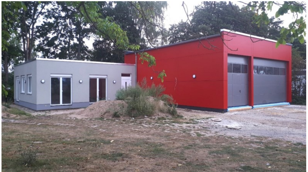
07.08.2022 Die Aussenfassade des AEZ ist weitestgehend hergestellt