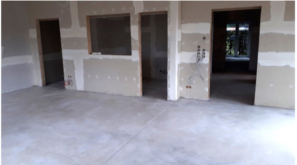
15.07.2022 Der Innenausbau wird fortgesetzt