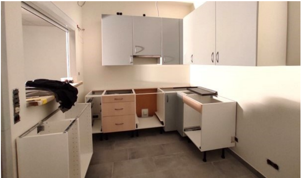
01.10.2022 Die ersten Küchenmöbel wurden in der Küche des AEZ eingebaut