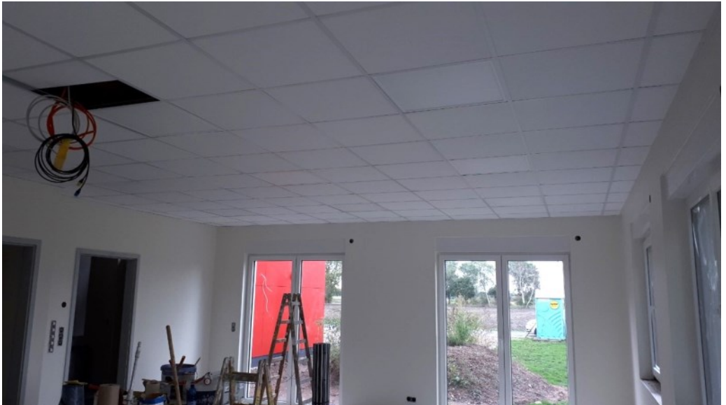
September 2022 Die Wände wurden gestrichen und die Decken eingebaut