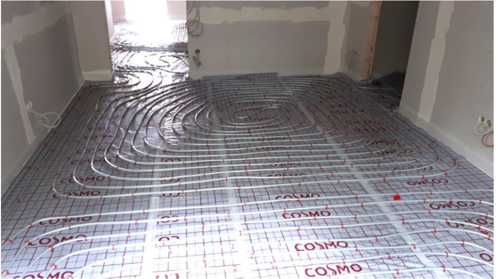
01.07.2022 Die Fußbodenheizung wird im AEZ verlegt