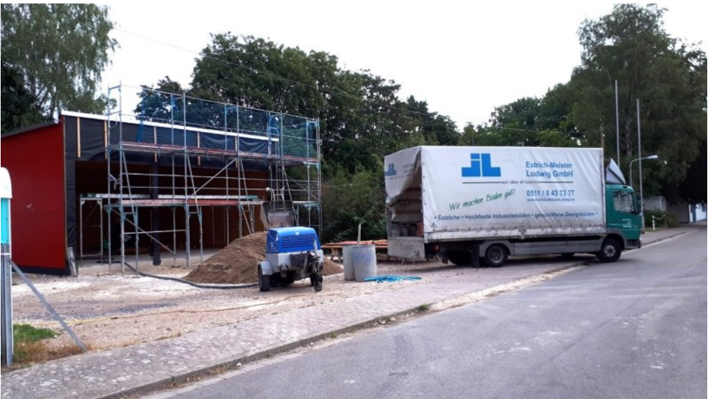
11.07.2022 Das AEZ bekommt seinen Estrichfußboden