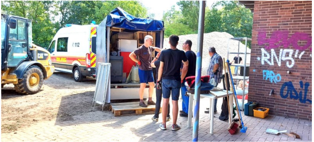
Vier Mal wurden Auto und Anhänger voll beladen