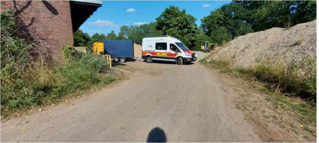
Die letzte Fahrt

haben die ersten Kurse und Ausbildungen längst geplant.