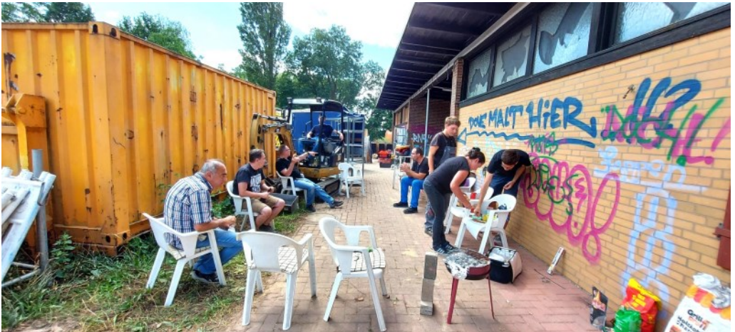
Auch Pause muss sein

Nun aber schauen wir voller Zuversicht nach vorne und warten mittlerweile ungeduldig auf die Fertigstellung unseres neuen Einsatz- und Ausbildungszentrums. In unserer Vorstellung steht schon alles und wir