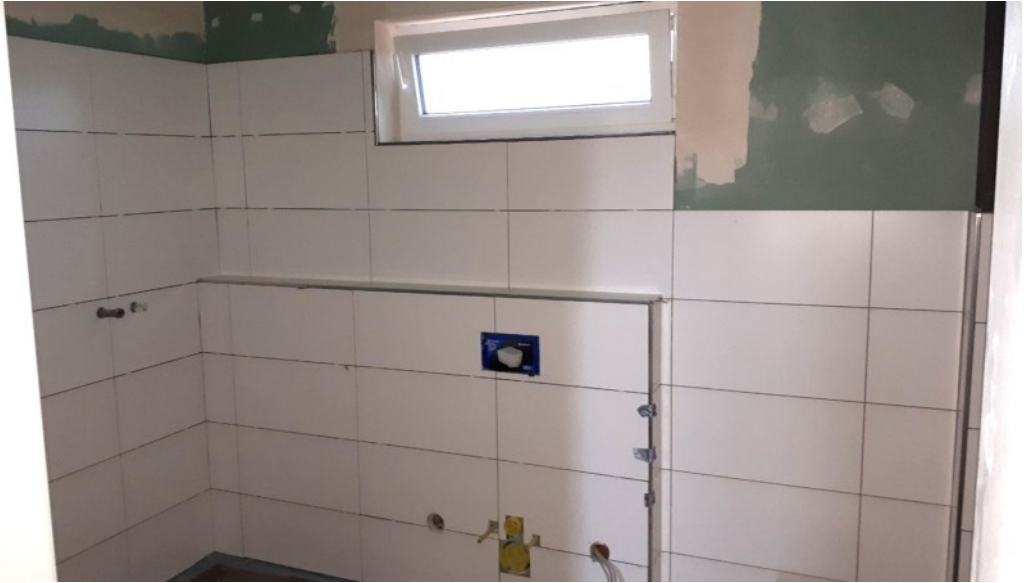
18.08.2022 Die WC-Räume erhalten ihre Fliesen