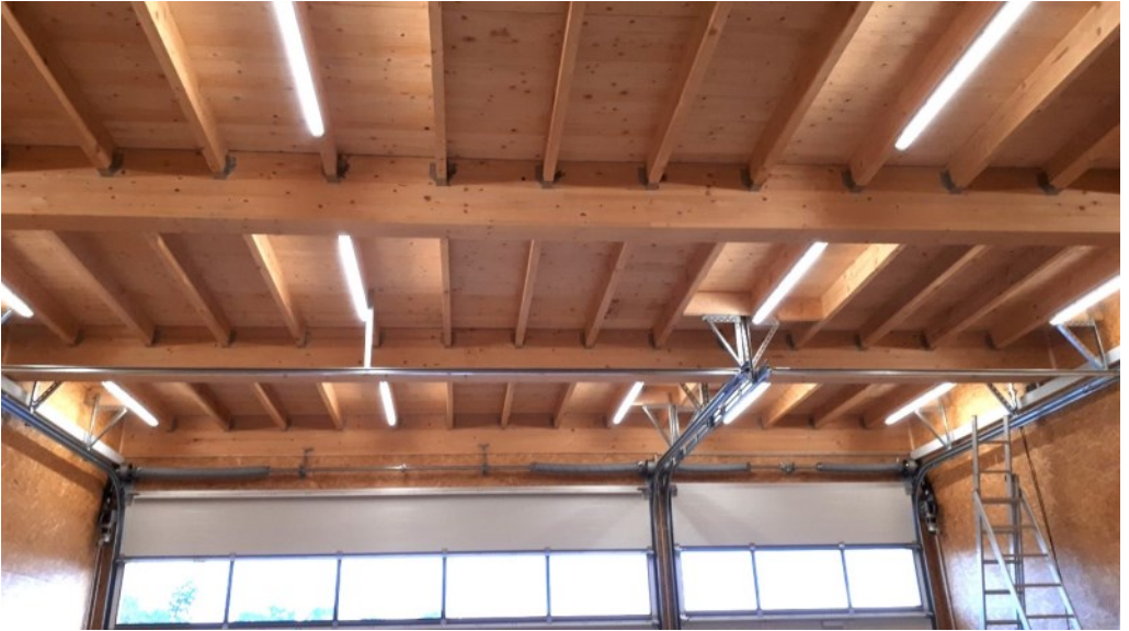
28.09.2022 Die Deckenbeleuchtung in der Mehrzweckhalle des AEZ besteht ihren ersten Test