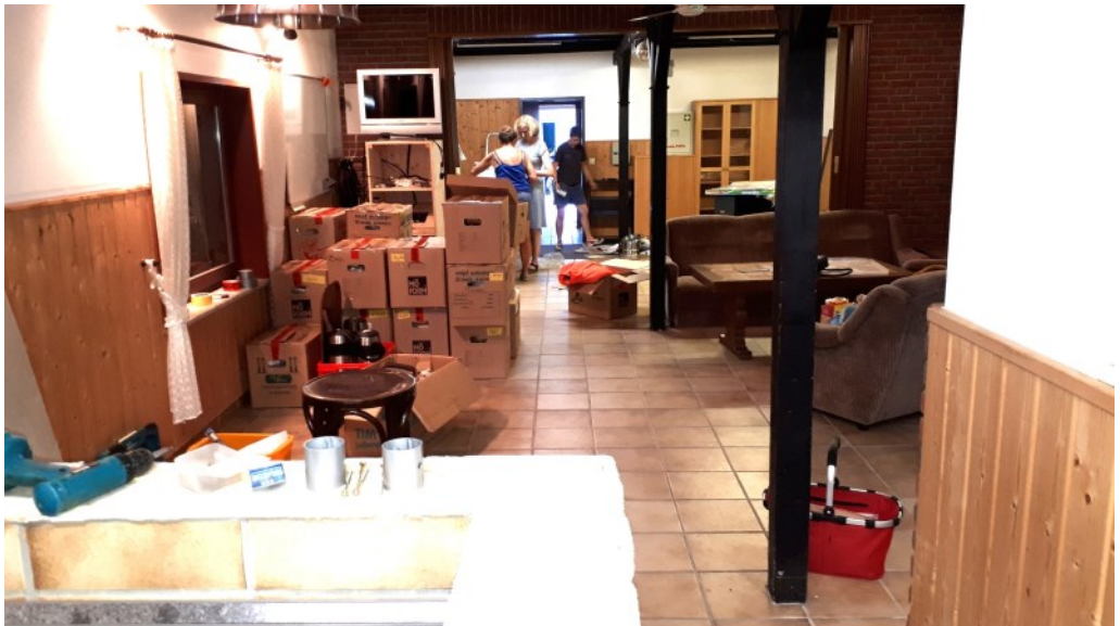
Das vorbereitende Packen

Viel wichtiger aber waren die ebenfalls unzähligen Ausbildungen unserer internen Einsatzkräfte und auch externer