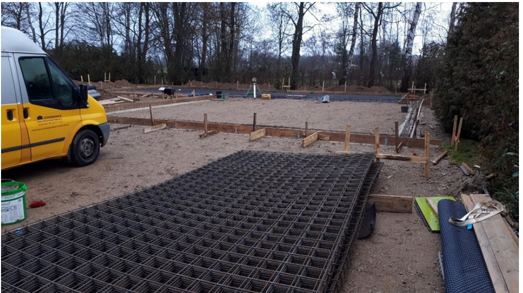
17.01.2022 die Vorbereitungen für die Bodenplatte laufen