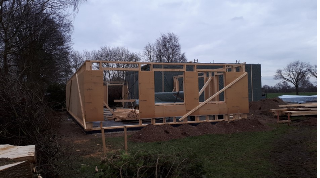
22.02.2022 Die Außenwände sind aufgestellt.