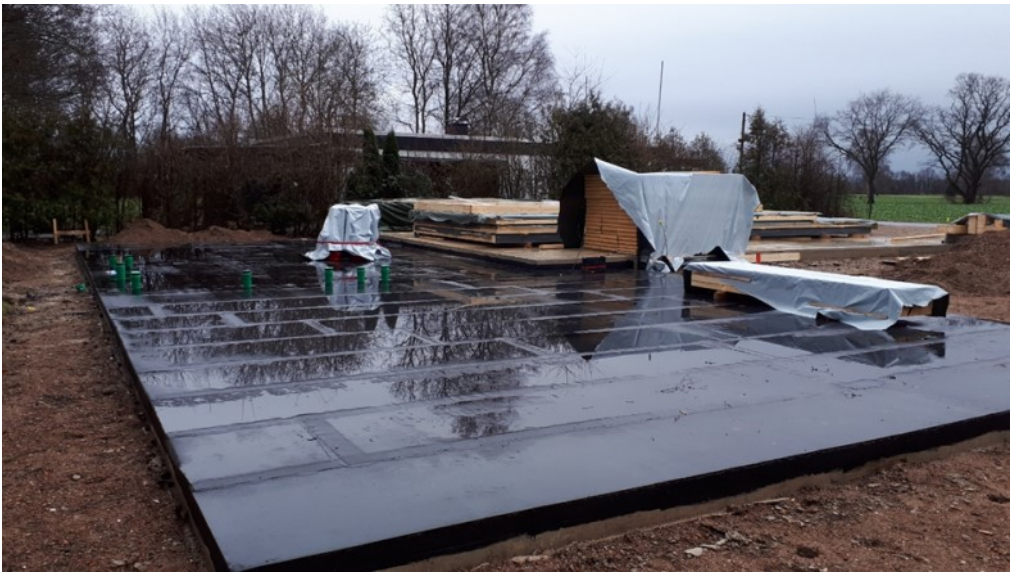
10.02.2022 Die Isolierung der Bodenplatte ist hergestellt und der Wand-aufbau beginnt.