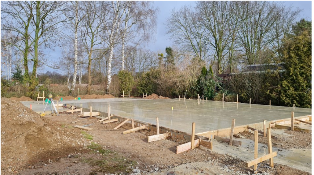
31.01.2022 Die Bodenplatte ist fertig