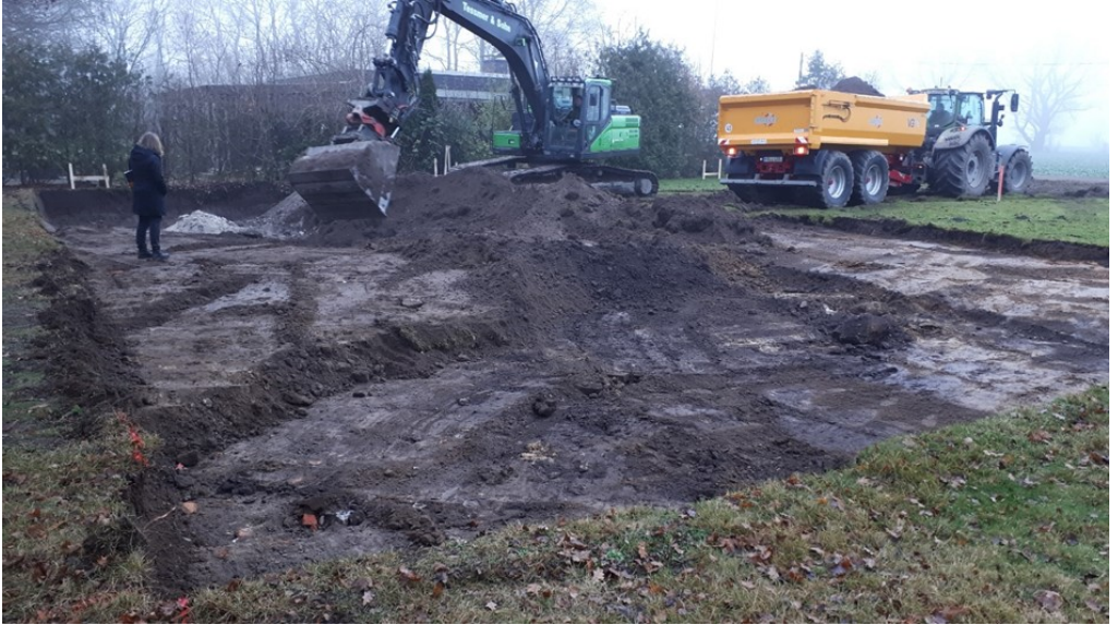
Der Startschuss fiel am 09.12.2021