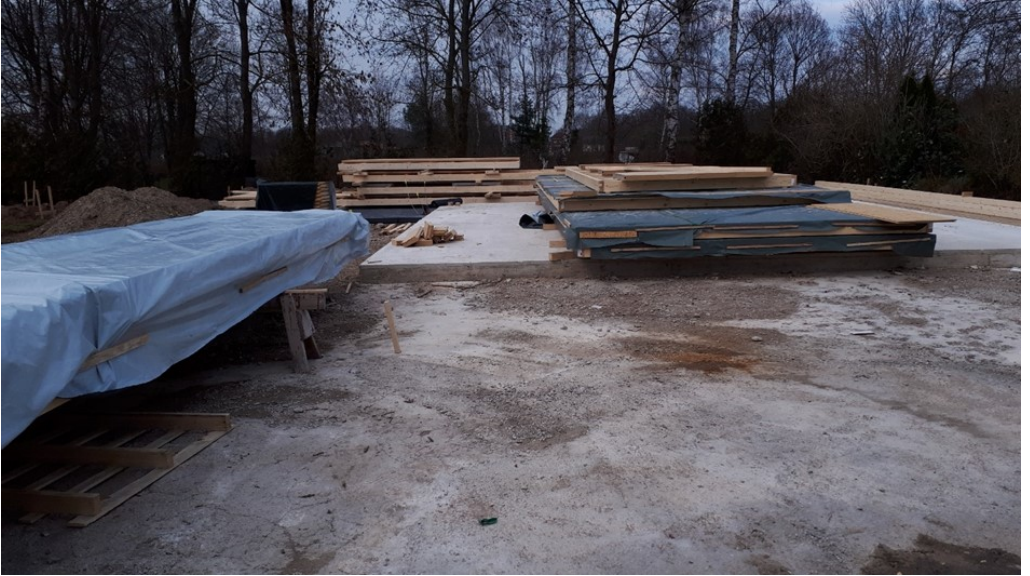
15.02.2022 Die Außenwände sind vorgefertigt.